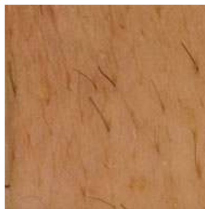
Tretirana površina: ispod pazuha. Tretmana: 5 (Žena, 25 godina, tip kože 4, smeđe dlake)