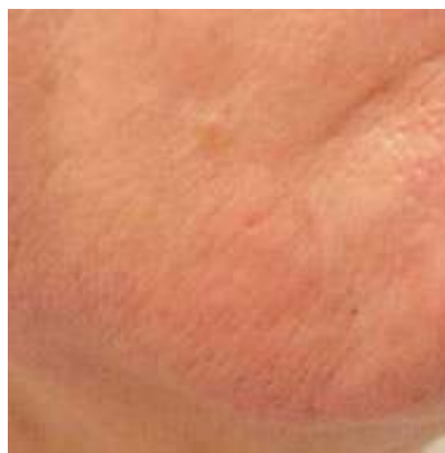
Tretirana površina: Brada. Tretmana: 6 (Žena, 60 godina, tip kože 1, bele dlake)