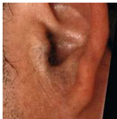
Tretirana površina: uši. Tretmana: 5 (Muškarac, 48 godina, tip kože 4, crne i bele dlake)